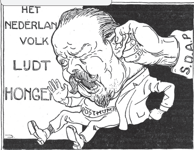
Bron 11 Prent van Braakensiek

In deze opdracht hou je er rekening mee dat heden- daagse en toekomstige verschijnselen worden beïnvloed door het verleden en wat zij te maken hebben met het heden. Zie vaardigheden 12 en 13.