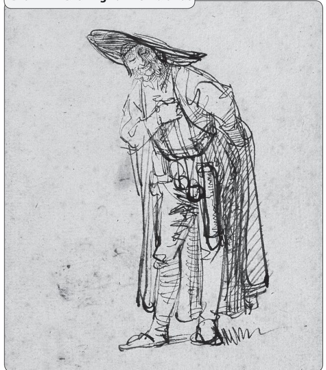
Bron 12 Tekening van Rembrandt

Rembrandt schilderde concreet; Mondriaan abstract en Rembrandt schilderde met primaire kleuren; Rembrandt niet.