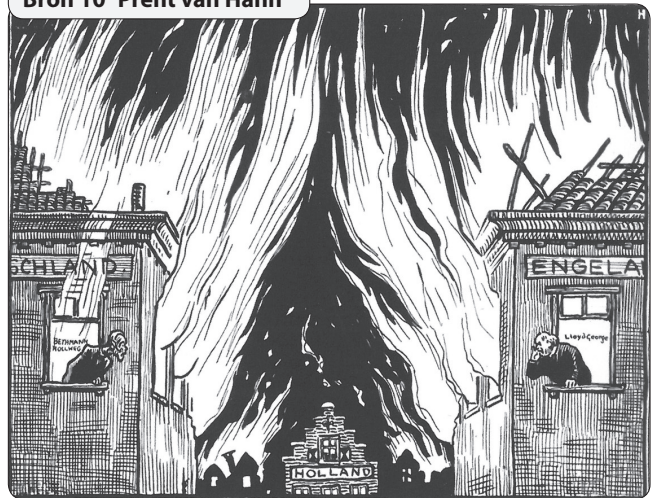
Bron 10 Prent van Hahn

Ja, omdat Nederland niet in de brand staat (oorlog voert), maar de landen rondom wel.