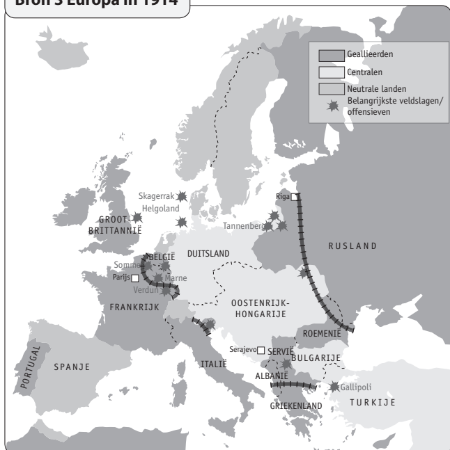
Bron 3 Europa in 1914

c Bekijk de fronten waarbij Duitsland direct betrokken is. Welk vet gedrukt begrip uit de tekst past hierbij?